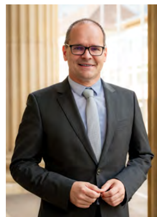
Niedersächsischer Minister für Wirtschaft, Verkehr und Bauen